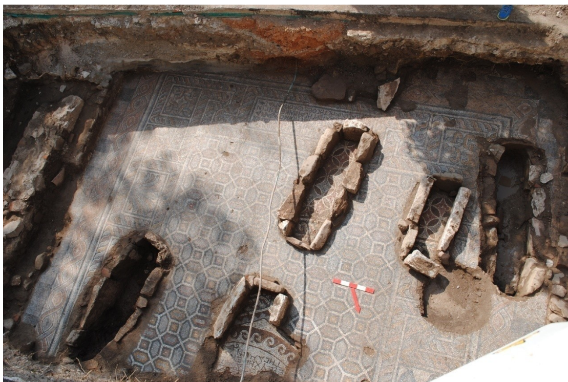
Εικ. 6: Το πρανές στην δυτική πλευρά

Συνολικά τα ανασκαφικά πρανή έχουν παραμείνει αδιαμόρφωτα και έχουν προβλήματα ευστάθειας χωρίς να ανταποκρίνονται στις ανάγκες ασφάλειας, προστασίας και αναγνωσιμότητας του μνημείου από τους επισκέπτες του.