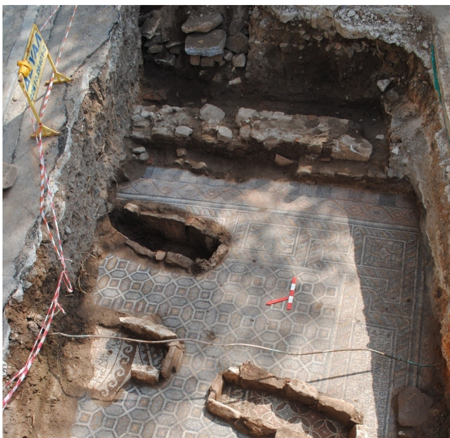
Εικ. 6: Το πρανές στην νότια πλευρά, κατά την διάρκεια της ανασκαφής

Έχει ακανόνιστο σχήμα και το μεγαλύτερο ύψος, περίπου 1,90 μ. Στο κατώτερο στρώμα του αποκαλύφθηκε τμήμα τοιχοποιίας.