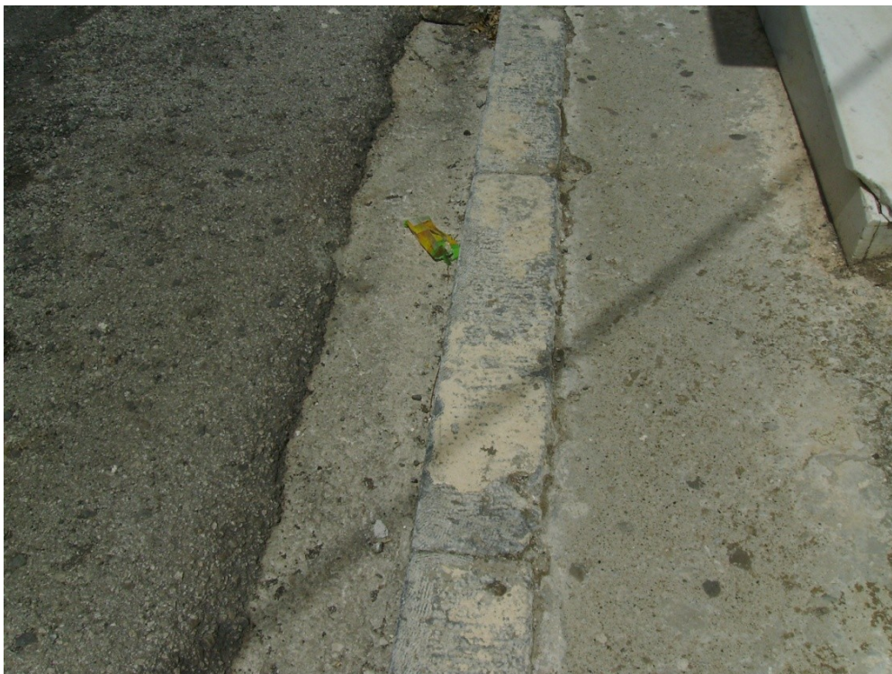
Εικ. 7: Το πεζοδρόμιο της ανατολικής πλευράς με το κρiασπεδο μαρμάρου