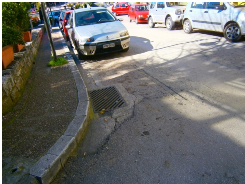
Εικ. 11: Πεζοδρόμιο της οδού Σπυροπούλου