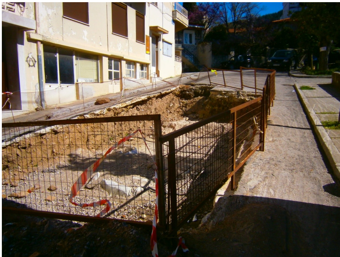
Εικ. 3: Προσωρινή περίφραξη και επίχωση ευρημάτων