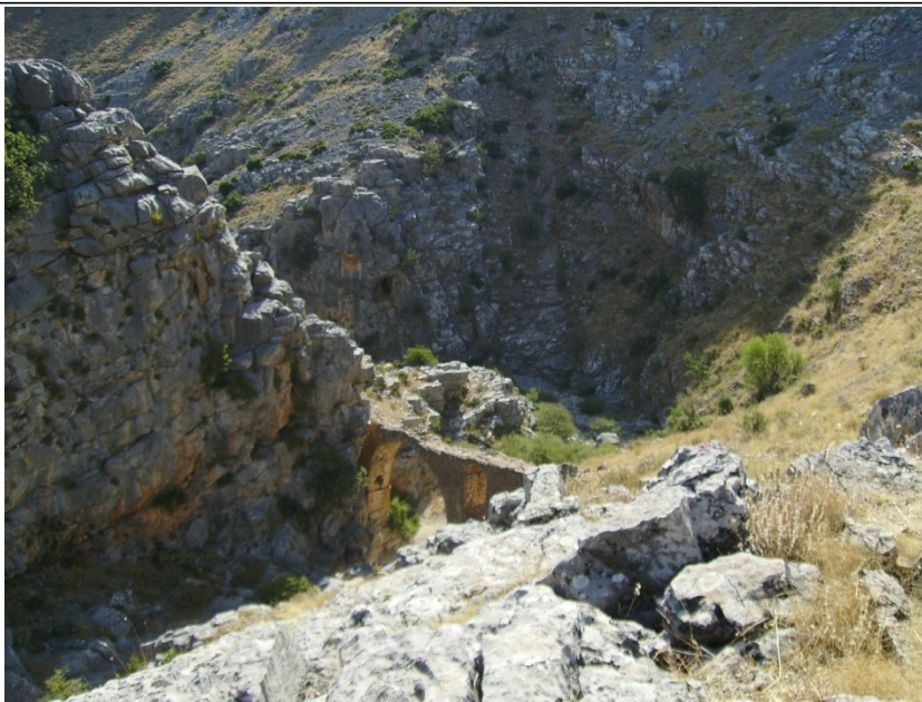
Το Τρίχινο Γεφύρι

Το Τρίχινο Γεφύρι , βρίσκεται στο πιο στενό σημείο του χειμάρρου που διασχίζει το φαράγγι της Κρύας, περίπου 1.100 μ απόσταση από τις πηγές. Το τοπίο είναι αξιόλογο, όπως και το ίδιο το γεφύρι. Οι βραχώδεις όγκοι που το πλαισιώνουν, περιορίζουν το άνοιγμά του και βοηθούν την στέρεη θεμελίωσή του. Το γεφύρι είναι μονότοξο, ενώ από τα ανατολικά και τα δυτικά του κεντρικού τόξου, πάνω από τα βάθρα, υπάρχουν άλλα δυο τοξωτά ανοίγματα, διαφορετικής μορφολογίας. Το γεφύρι είναι στενό (1.90μ) και τα υπολλείματα πήλινων αγωγών που βρέθηκαν ανάντι και κατάντι του χειμάρρου, υποδηλώνουν ότι το γεφύρι προοριζόταν για την μεταφορά νερού.