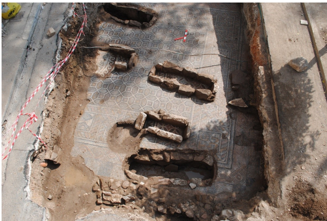
Εικ. 4: Αποψη του βόρειου και του ανατολικού ορίου κατά την ανασκαφή

Έχει κυμαινόμενο ύψος, από 0,70 έως 1,90μ. Κατά μήκος του περνάει ο αγωγός αποχέτευσης της ΔΕΥΑΛ. Κάτω από τις στρώσεις οδοστρωσίας υπάρχουν χαλαρά εδάφη με υπόλοιπα οργανικών υλικών (ρίζες)