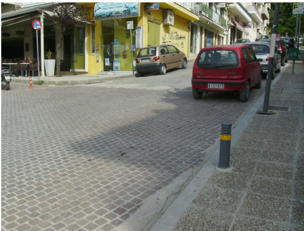
Εικ. 10: Η οδός Καραγιαννοπούλου στην συμβολή της με την οδό Σπυροπούλου

Στην εικόνα 11 φαίνεται η υφιστάμενη κατασκευή του πεζοδρομίου στο δυτικό τμήμα της αρχής της οδού Σπυροπούλου, με κράσπεδα γκρί μαρμάρου Λιβαδειάς και βοτσαλόπλακες χρώματος γκρί-κεραμιδί. Η ίδια κατασκευή θα συνεχιστεί και απέναντι.