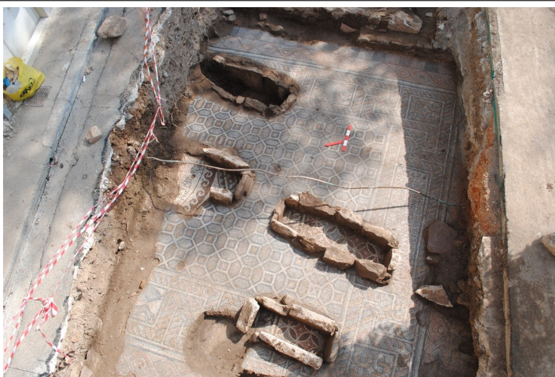
Εικ. 1.Τα ψηφιδωτά δάπεδα στην οδό Σπυροπούλου

Το νεώτερο ψηφιδωτό , για το οποίο έχουμε μια πιο ολοκληρωμένη εικόνα, αποτελείται από γεωμετρικά σχέδια .Λωρίδες σε τέσσερα εναλλασσόμενα χρώματα και διακοσμητικά μοτίβα (πλοχομοί, μαϊνδροί ) , περιγράφουν το κεντρικό σχέδιο με τα οκτάγωνα . Στο πρωιμότερο ψηφιδωτό φαίνονται ταινίες με πιο απλούς πλοχμούς και μοτίβο με κύκλους. Τόσο το νεώτερο όσο και το πρωιμότερο στρώμα φέρουν επιγραφές.