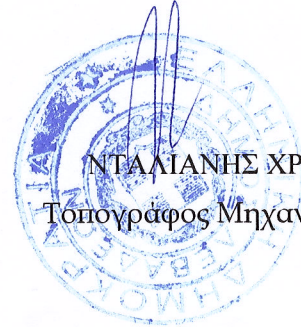
ΝΤΑΛΙΑΝΗΣ ΧΡ. Τοπογράφος Μηχανικός